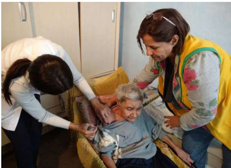
Idosa é imunizada em sua residência no Plimec

Prosegue em Avaré a vacinação contra a gripe H1N1. Dados da Vigilância Epidemiológica, órgão vinculado à Secretaria Municipal da Saúde, contabilizam até 5 de maio 11.696 doses aplicadas da vacina. A meta da campanha na cidade é imunizar 19.465 pessoas dos grupos prioritários. Devem tomar a vacina crianças entre 6 meses e menores de 5 anos, gestantes e puérperas (que