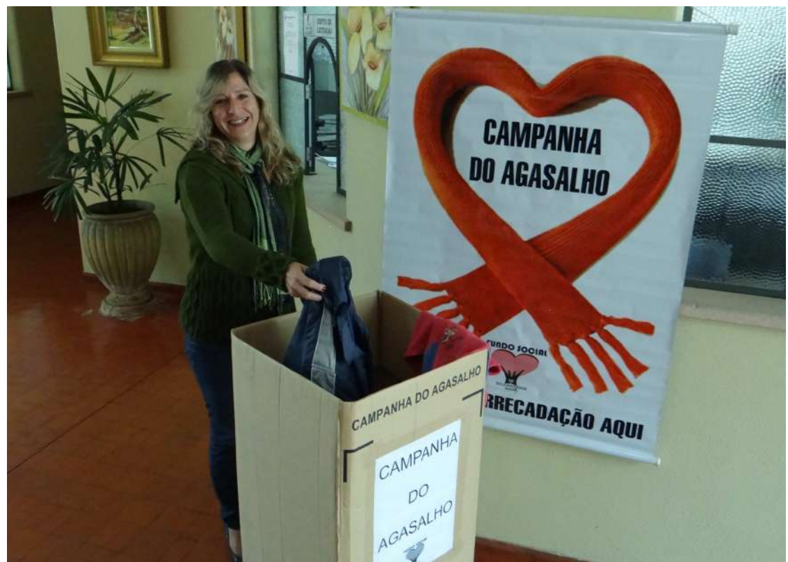
Caixas coletoras estão distribuídas nos prédios municipais