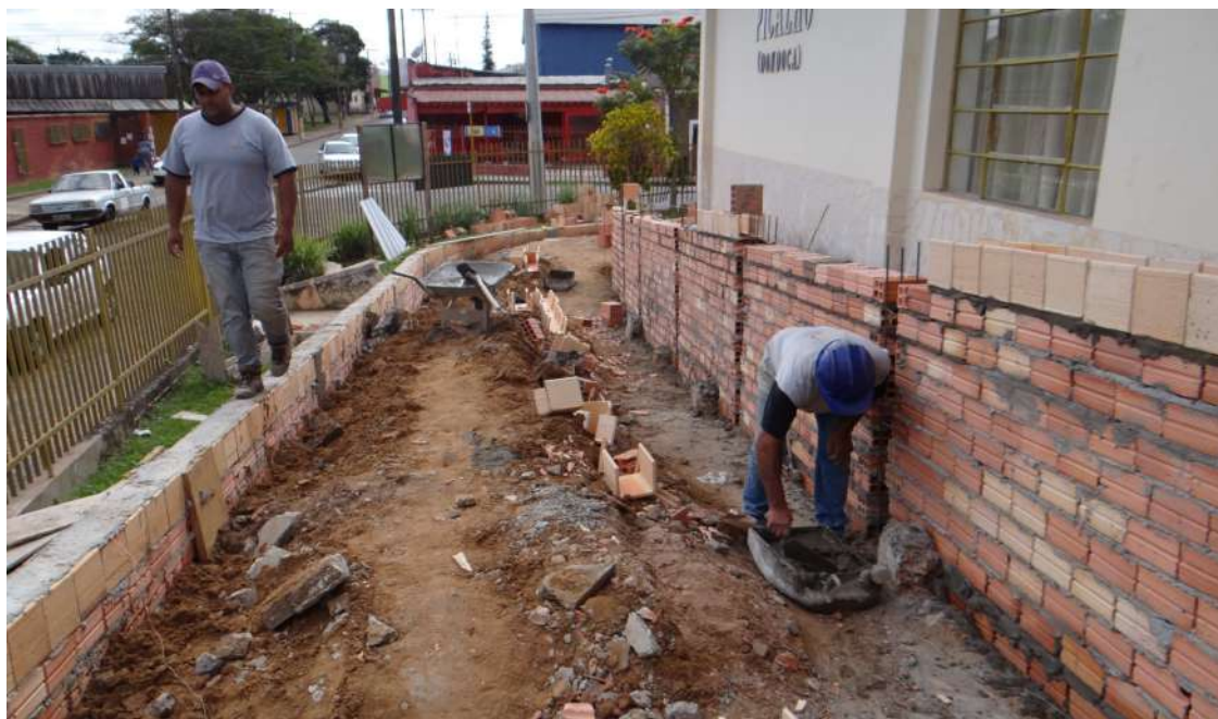
Rampa de acessibilidade está sendo construída na parte frontal do prédio

A empresa responsável pelas obras já está trabalhando na reforma dos banheiros masculino e feminino e na edificação de uma rampa de acessibilidade. A cozinha e a secretaria da escola passarão por troca de piso e a planilha prevê ainda pintura geral, interna e externa, e projeto de prevenção do Corpo de Bombeiros. A previsão para o término é de quatro meses.