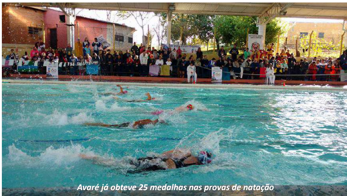
Avaré já obteve 25 medalhas nas provas de natação

Avaré disputa a liderança da 2ª Divisão e conquistou ouro no Basquete feminino, no Futsal masculino, na Malha, na Bocha e no Tênis feminino