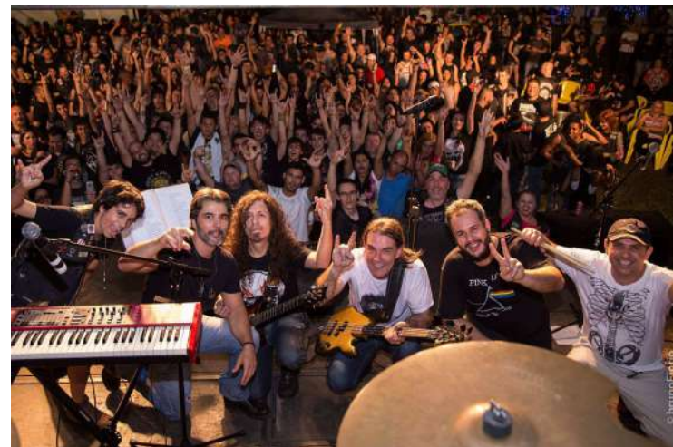
Banda Rock 70 apresenta repertório de clássicos do rock and roll

No palco, a banda Rock 70 apresentará repertório com sucessos musicais das bandas Van Halen, Led Zeppelin, ZZ Top, Black Sabbath e Beatles.