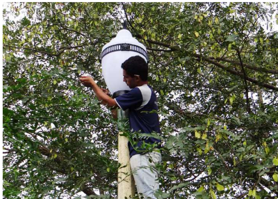
Recursos vieram do Governo do Estado

De acordo com o cronograma de obras, previamente aprovado pelo Conselho Municipal de Turismo, estão sendo feitas intervenções no prédio da Concha Acústica, haverá troca de iluminação da praça, melhorias no seu paisagismo e nas suas instalações hidráulicas e elétricas, ampliação, reforma e nova destinação dos quiosques do lanchódromo, construção de dois sanitários públicos e abertura de ligação calçada para o monumento "O Desbravador", obra do escultor Fausto Mazzola.