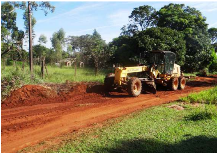
Manutenção das ruas do bairro Ponta dos Cambarás