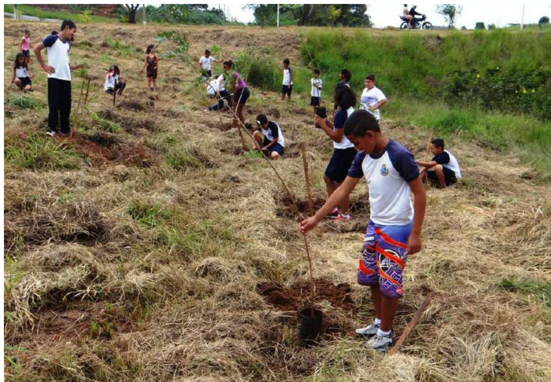
Alunos da Rede Municipal de Ensino participam de ação no Dia Mundial da Água

"O plantio de árvores numa área de proteção ambiental e às margens de um curso d'água é fundamental. Essas novas árvores vão ajudar na preservação da água existente, pois temos que cuidar das nascentes para que sempre tenhamos água em nossas torneiras", destacaram os educadores.