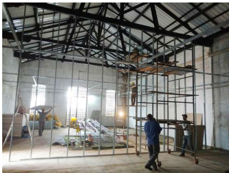
Local que abrigará as aulas de música e teatro

Revitalizado com recursos próprios, o Centro Cultural