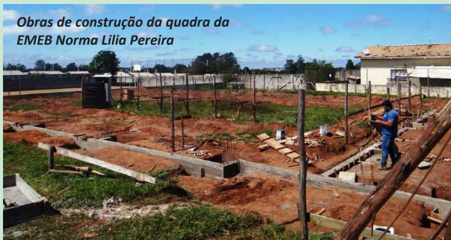
Obras de construção da quadra da EMEB Norma Lília Pereira

Para melhor estruturar as unidades escolares do município, a Prefeitura prossegue o seu cronograma de investimentos na Educação para que os alunos do ensino fun-