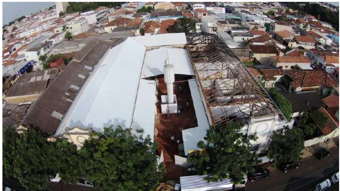
Telhado está sendo trocado