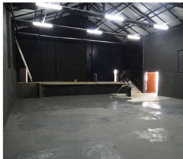
Auditório Elias Almeida Ward recebe preparativos finais

atividades culturais. Nesse empreendimento a Prefeitura reservou recursos próprios, investiu R$ 889 mil e transformou 1.500 metros quadrados numa grande área para a livre expressão das artes. Página 24.