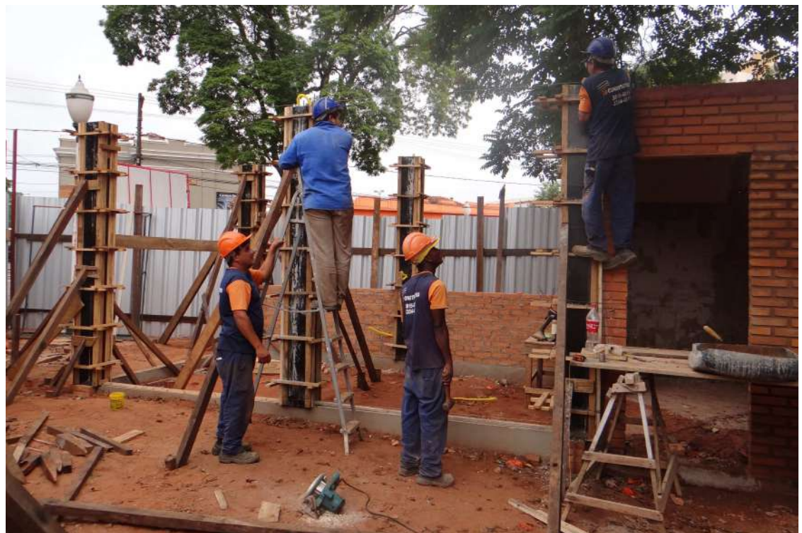
Revitalização do "Lanchódromo" têm mão de obra da cidade