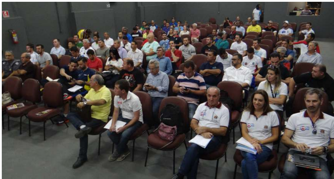
Congresso Técnico aconteceu no Auditório Elias de Almeida Ward

Avaré disputará os Jogos Regionais nas modalidades atletismo, basquete masculino e feminino, bocha, ciclismo, damas, futebol, futsal, handebol, judô, karatê, malha, tênis, tênis de mesa e xadrez.