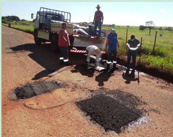
Operação Tapa-buracos na estrada da Barra Grande