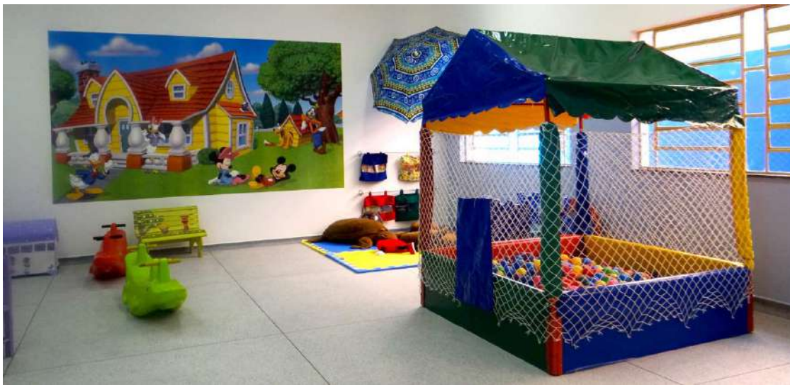
Brinquedoteca em creche municipal

Unidades de Educação Infantil serão construídas no Residencial São Rogério e no Jardim Dona Laura, bairro aberto ao lado da Vila Jardim. Obras integram o plano do Governo Municipal de ampliar a oferta de vagas em creches no município.