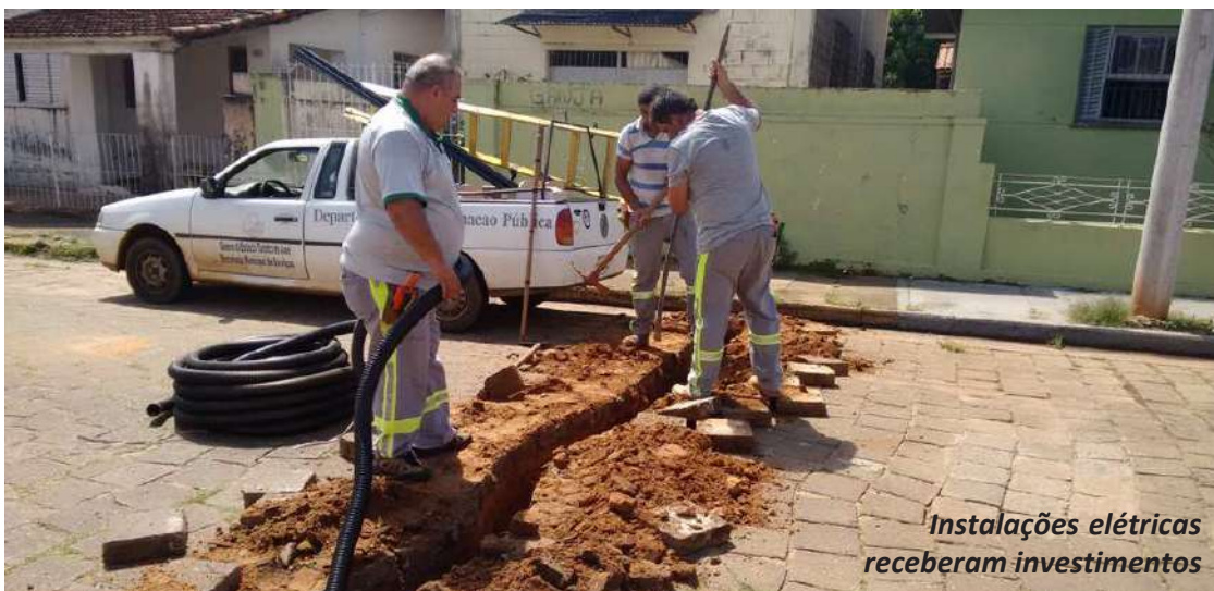
Instalações elétricas receberam investimentos