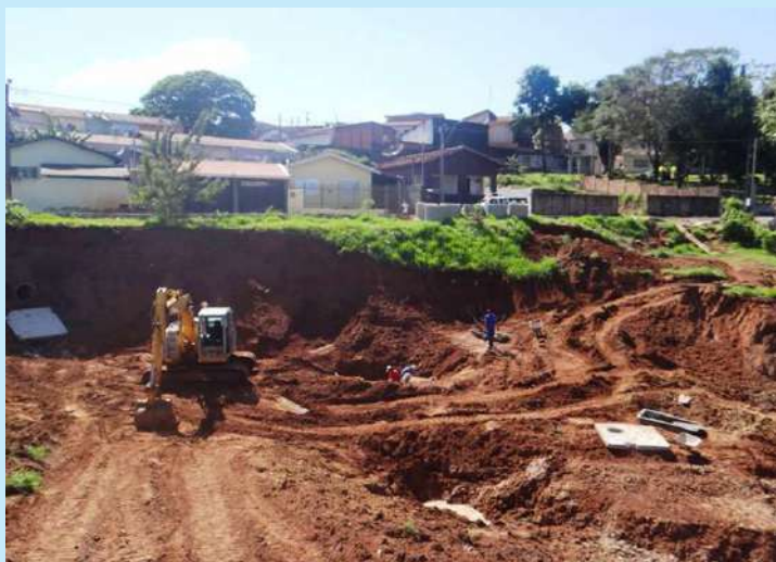
Obras na Rua Roldão Euphrasio Leal

A Prefeitura da Estância Turística de Avaré está fazendo uma série de investimentos para conter áreas atingidas por erosões localizadas em diferentes pontos urbanos. Contratada, a construtora Portal do Vale está recons-