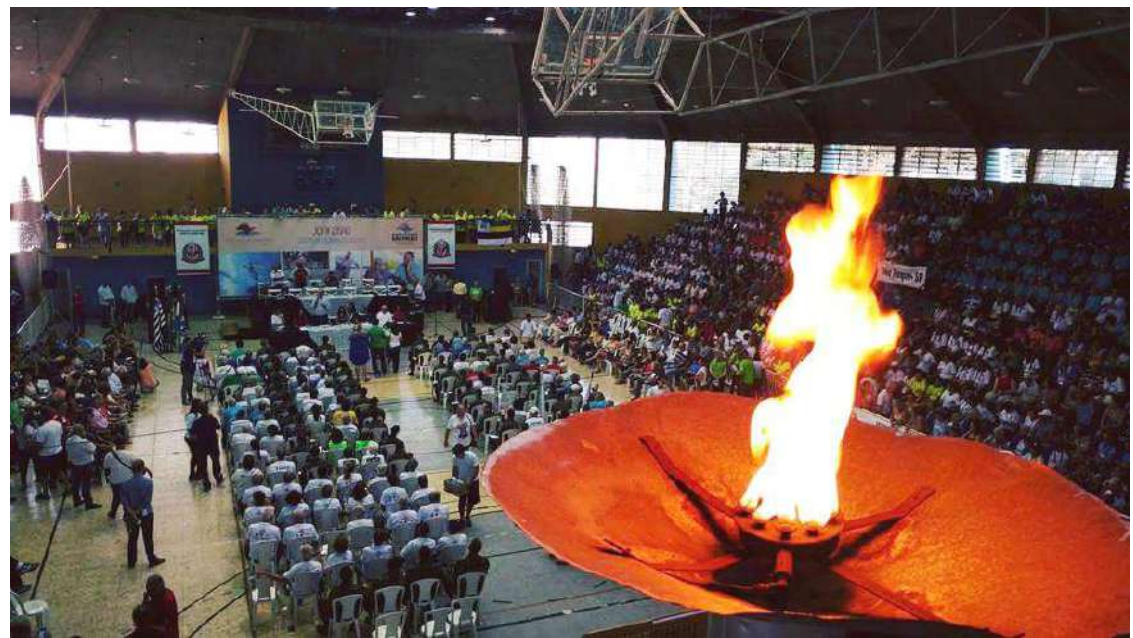
Pira Olímpica acesa durante os Jogos Regionais do Idoso em Avaré

Biblioteca e Poupatempo oferecem acesso gratuito à internet