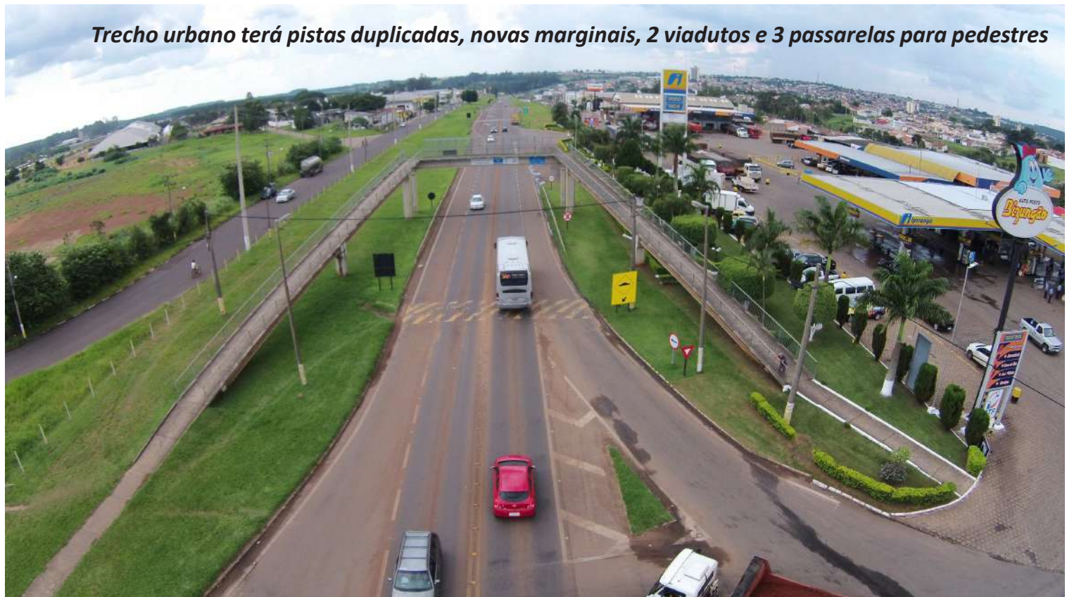
Trecho urbano terá pistas duplicadas, novas marginais, 2 viadutos e 3 passarelas para pedestres