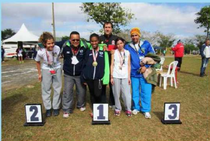
Atletas do atletismo ACD, masculino e feminino