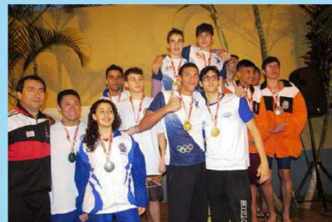
Atletismo ACD feminino, natação feminina e masculina conquistaram a medalha de ouro