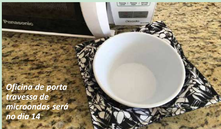
Oficina de porta travessa de microondas será no dia 14

Pelo segundo ano consecutivo, a Prefeitura vai apoiar a promoção da Feira Artesanal de Avaré, que terá lugar no Parque Fernando Cruz