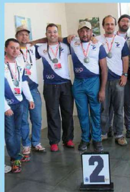
Basquete masculino levou a medalha de ouro e o xadrez ficou com a prata

Realizada na Estância Turística de Avaré, a 60ª edição dos Jogos Regionais da 8ª Região Esportiva do Estado de São Paulo encerrou-se no último dia 30, quando ficaram conhecidos os vencedores das duas divisões em disputa: Sorocaba, na 1ª Divisão, e a cidade sede, Avaré, na 2ª Divisão.