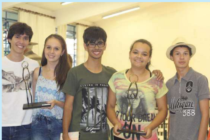
Integrantes dos grupos Amigos da Música e Five Secrets, que conquistaram o 1º e 2º lugares

Realizada no último fim de semana, a segunda edição do Festival de Talentos Culturais de Avaré, que tem como objetivo incentivar e fomentar as manifestações artísticas da cidade, teve como vencedor o grupo de jovens, Amigos da Música, que atingiu 192 pontos.