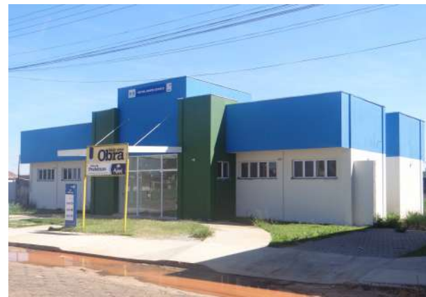
UBS do Paraíso, Plimec e Jardim Paineiras serão inauguradas no próximo mês

Prioridade da Prefeitura, a conquista de investimento para prover melhor atendimento de saúde vai garantir melhorias em vários bairros da cidade. No próximo mês de maio, a Secretaria de Saúde vai inaugurar quatro novas unidades de saúde no Plimec, Paineiras, Santa Elizabeth e Paraíso.