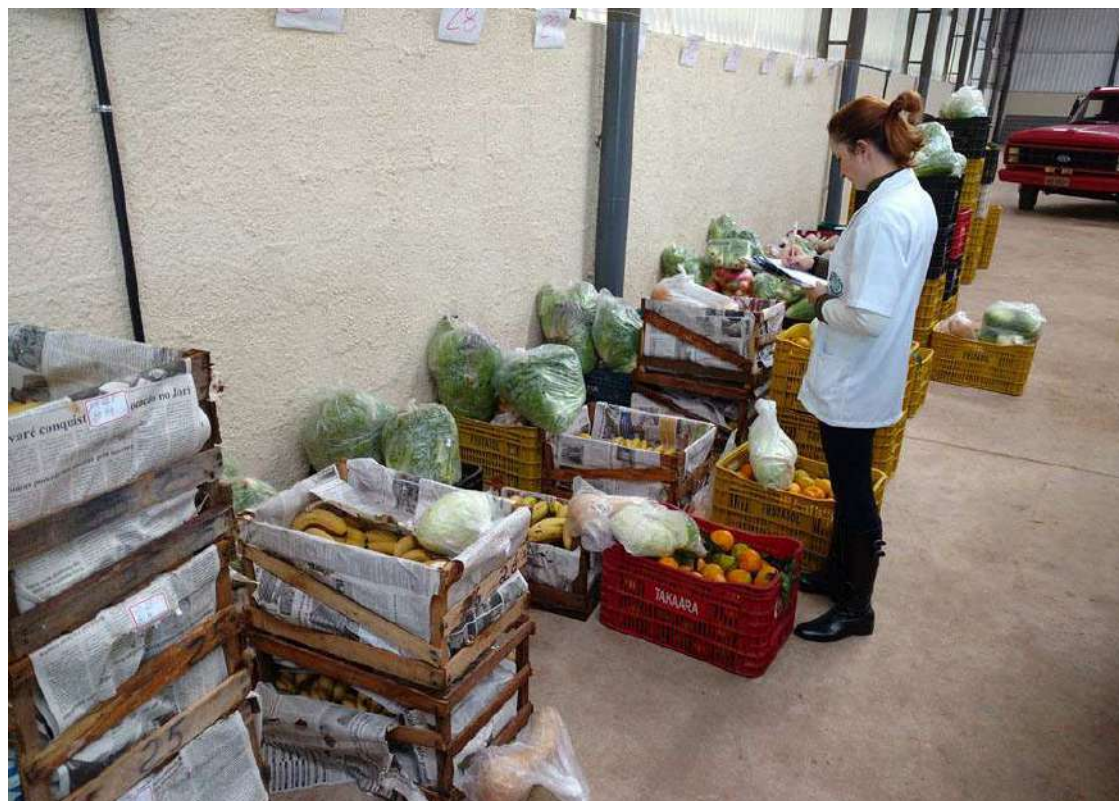
Nutricionista confere produtos recebidos no Galpão