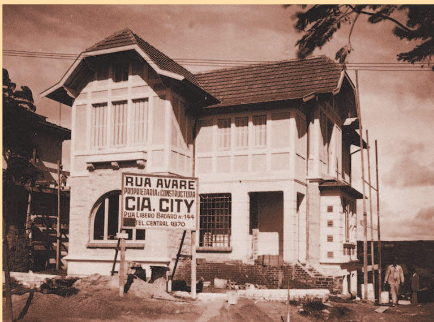
Obras na Rua Avaré no bairro paulistano de Higienópolis, década de 1950

O nome Avaré é encontrado em logradouros pelo Brasil afora, de Norte a Sul. Em área nobre da capi-