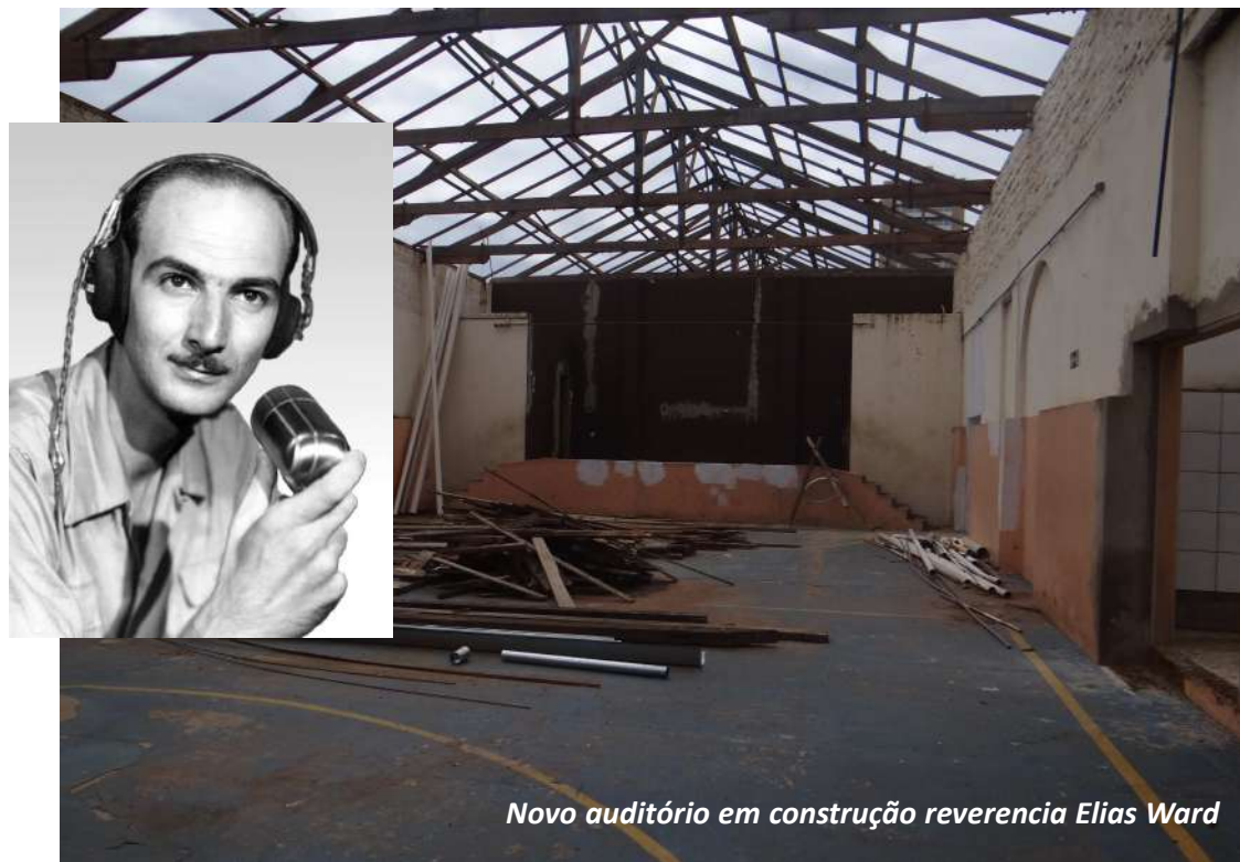
Novo auditório em construção reverencia Elias Ward

HOMENAGEADO - Símbolo do meio cultural e esportivo, o nome do jornalista e cerimoniário Elias de Almeida Ward (1925-2013) foi dado ao novo auditório. Avareense, Elias destacou-se como ativista cultural, dirigiu a Rádio Avaré AM, criou a antiga Corrida de São Silvestre e conduziu o cerimonial da Prefeitura e da Câmara de Avaré entre as décadas de 1960 e 1990.