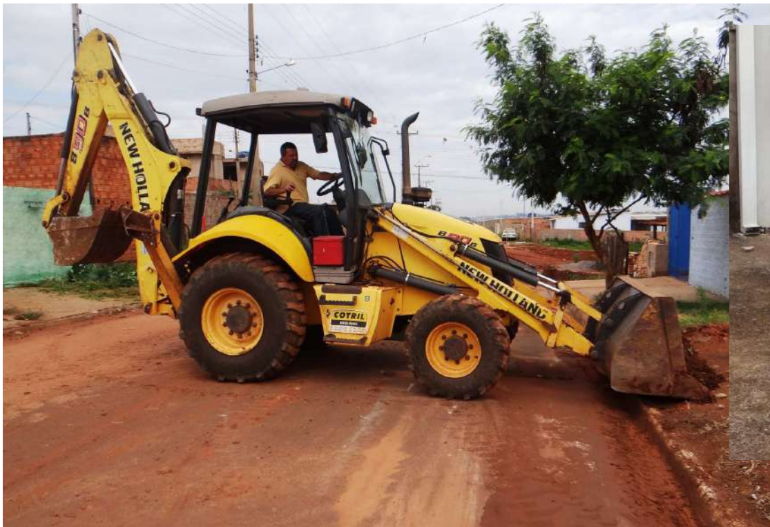
Trator executa limpeza de terreno baldio