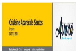
Assinatura.jpg 32 KB