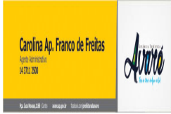
Carolina.jpg 33 KB