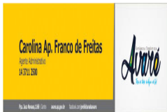
Carolina.jpg 33 KB