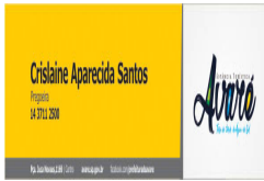
Assinatura.jpg 32 KB