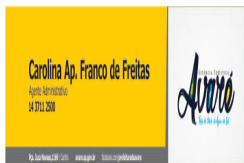
Carolina.jpg 33 KB