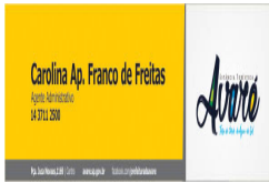
Carolina.jpg 33 KB

Rota Assessoria e Publicidade Legal LTDA Avenida Presidente Vargas, 2121 - 23º andar - sala 2302 - Jardim Santa Angela Edifício Times Square Business - CEP: 14020-260 Ribeirão Preto – SP (16) 4042-0944 www.rotapublicidade.com